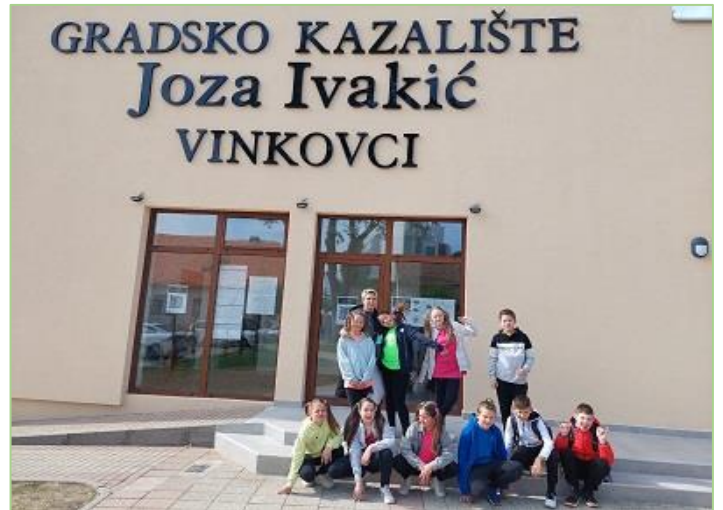
Slika 16: državni LiDraNo