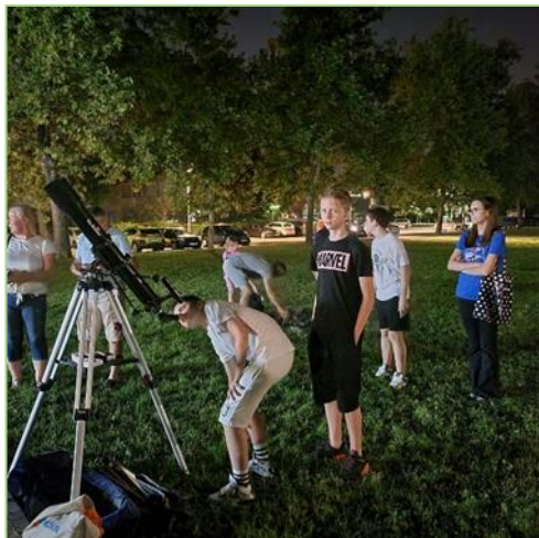
Slika 4: promatranje teleskopima

Cilj je projekta popularizacija prirodnih znanosti s naglaskom na primjer izvanučionične nastave koja se danas u Europskoj uniji smatra najboljim i najučinkovitijim segmentima obrazovnog sustava. Učenicima i zainteresiranim učiteljima osnovnih škola grada te građanima Samobora održana je radionica „Promatranje teleskopom“ na kojoj su svi prisutni učenici, učitelji i građani mogli kroz nekoliko postavljenih teleskopa promatrati noćno nebo, a održano je i predavanje „Tajne sunčevog sustava“. U sklopu projekta, a u svrhu popularizacije astronomije i izvanučionične nastave, učenici astronomske grupe OŠ Bogumila Tonija prezentirali su svoje istraživačke radove.