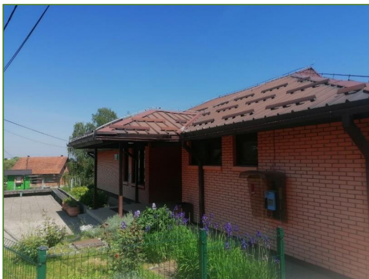
Slika 2: PŠ Mirnovec

Niža pučka škola u Mirnovcu otvorena je 1911. godine. Od tada se nastava za djecu Male i Velike Rakovice, Slavagore i Kladja odvija gotovo neprekidno. Broj obveznih polaznika kretao se od stotinjak do čak 260 učenika. Nažalost, školu nisu pohađali svi obveznici, a i oni koji jesu, polazili su ju neredovito. Glavni razlog je, prema zapisima učitelja, bilo siromaštvo, nisu imali novca za odijelo i obuću. Djeca su morala pomagati na polju, čuvati krave i raditi kućanske poslove. Kada 1972. godine OŠ Bogumila Tonija počinje sa svojom odgojno-obrazovnom djelatnošću, Mirnovec postaje područna škola toj ustanovi. Nastava se u staroj zgradi održavala do proljeća 1983. godine. Uz dotrajalu je zgradu 1983. svečano otvorena nova montažna školska zgrada.