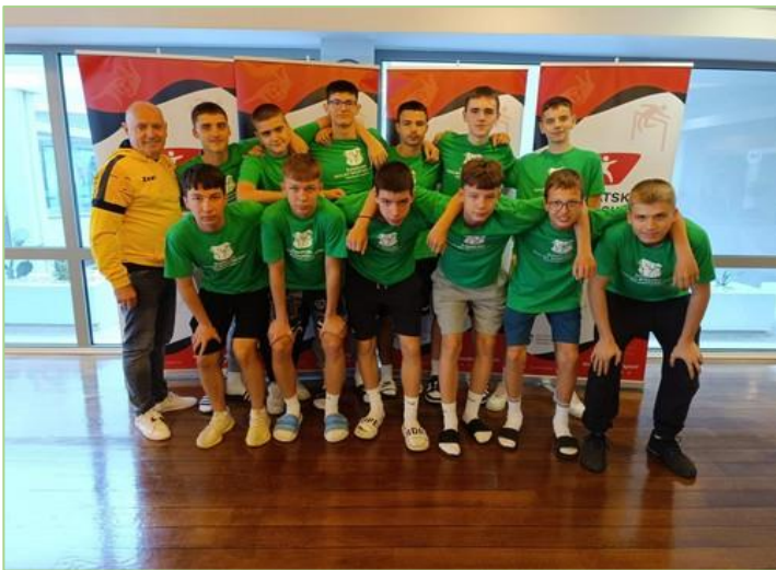
Slika 21: košarkaška ekipa