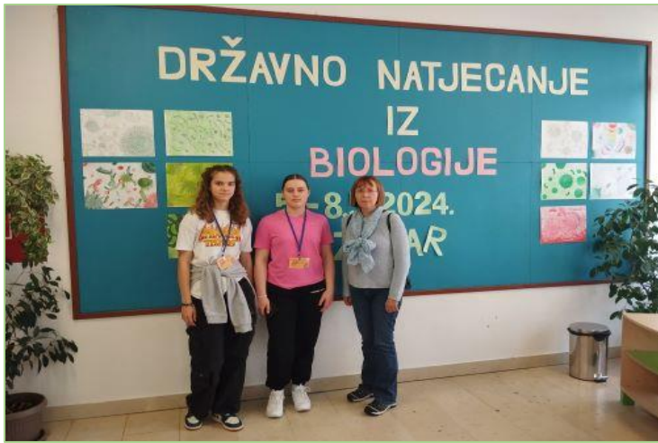
Slika 15: državno Natjecanje iz biologije