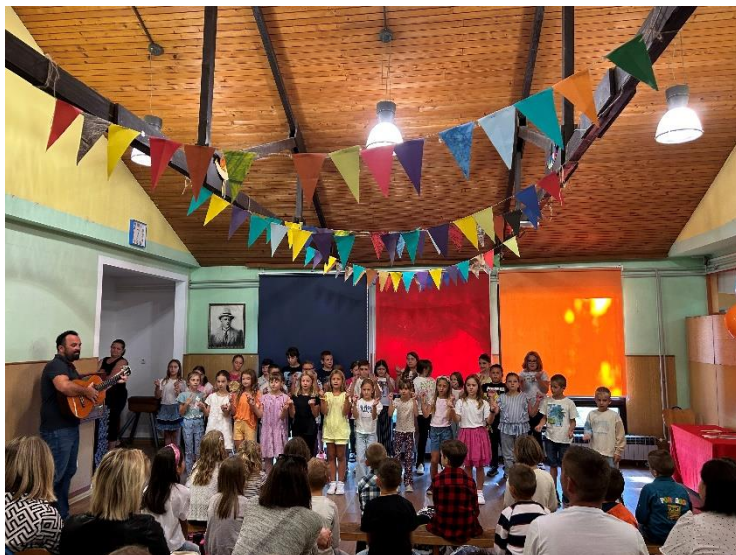
Slika 3: Priedba u PŠ Farkaševac