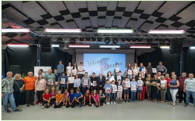
Slika 22: na primanju kod gradonačelnice