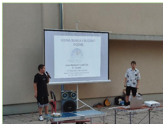
Slika 7: prezentacija učeničkih radova