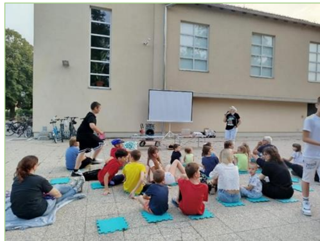
Slika 5: predavanje „Tajne Sunčevog sustava“