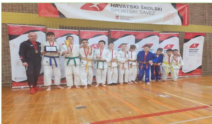
Slika 17: zlatni judaši